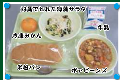
対馬でとれた海藻サラダ