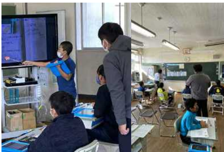
タブレット端末を活用した授業