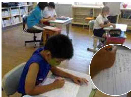
児童みんなで考えた歌詞