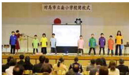
完成した曲を閉校式で披露

完成した「南小が好きなんだ」は、子どもたちの思いがいっぱい詰まった曲になりました。