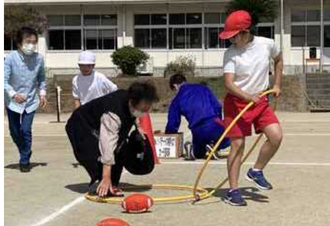
地域の人も大勢参加した運動会

また、タブレット端末を活用し、豊玉小学校での授業の様子を南小学校で共有して授業を展開するなど、子どもたちが抱える不安を自信に変える取り組みが行われました。