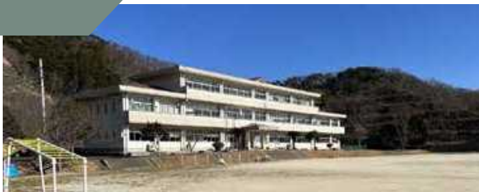
南小学校の校舎としての役割も終える

南小学校の校舎は現在二代目の建物です。10年前に移転した校舎は、平成23年度まで加志々中学校として使われていました。中学校が閉校し南小学校としての役割を果たす今でも加志々中学校の足跡が校内に残っています。