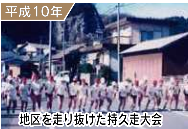
地区を走り抜けた持久走大会