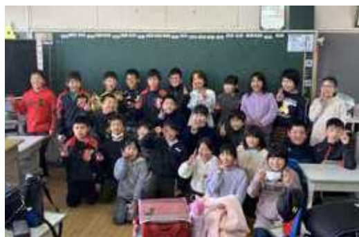
すっかり打ち解けた両校の子どもたち