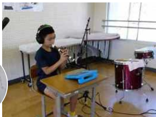
レコーディングもやりました!