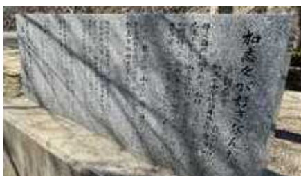
平成26年に地域の人たちによって校庭に設置された歌碑