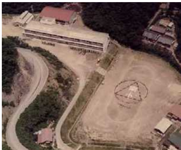
完成当時の航空写真（昭和50年頃）

豊玉村の西側に位置する学校にも関わらず、南小学校と名付けられたのには理由がありました。当時、全島に先駆けて学校統合によって生まれた学校なので、対馬の教育界に春風を運んでくれる存在になってほしいという願いを込め、春風と同じ意味を持つ「南風」から南小学校と名付けられました。