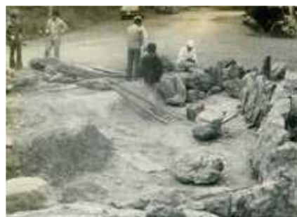
昭和52年11月に完成した池

学校での勉強よりも、先生が学校の外によく連れて行ってしてくれたことを覚えています。学校の周りの山で冒険したり、夏には海に行って泳いだりしてとても楽しかったです。小学校を卒業する時に、校庭に池を作りました。対馬の形をデザインして、穴を掘ったり石を並べたり、地域の人にも手伝ってもらって作ったのは良い思い出です。