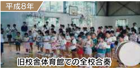
旧校舎体育館での全校合奏

令和4年3月をもって、南小学校と佐須中学校が閉校し、それぞれの歴史に幕を閉じます。広報つしまでは、それぞれの学校の歴史や最後の年の取り組みを紹介しています。今回は「対馬市立南小学校」です。