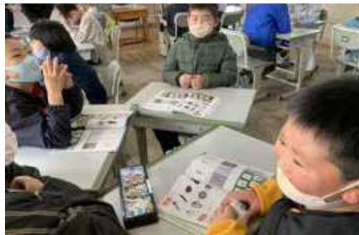
大人数での授業を体験