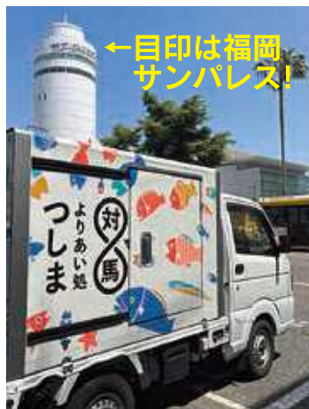
←目印は福岡サンパレス!