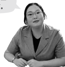
対馬市国際交流員

みなさんも今年のお盆には月を眺めながらお願いごとをするのはいかがでしょうか。また秋夕によく使うあいさつ言葉を紹介するのでぜひ使ってみてください。