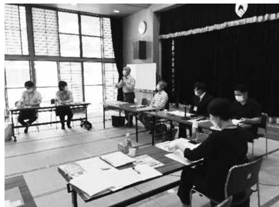
今後に向け活発に意見が交わされました