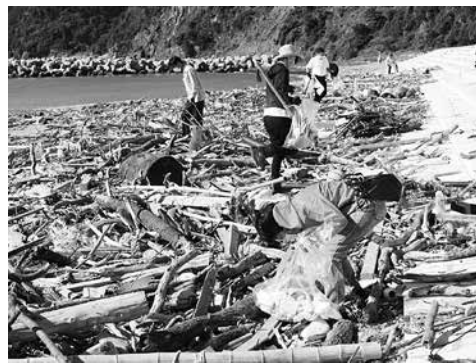
連携協定締結式前に行われた関西経済同友会グリーン関西推進委員会による海岸清掃ボランティア(小茂田浜)