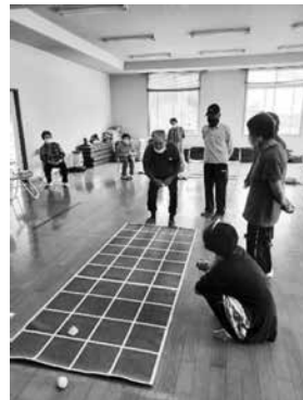
スクエアステップのマットを使ってお手玉！