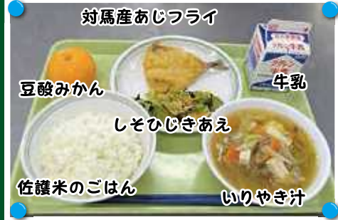
対馬産あじフライ 豆酸みかん 牛乳 しそひじきあえ 佐饗米のごはん いりやき汁

この日は、地場産物使用推進週間の取組として「まるごと長崎県給食」として提供をしました。