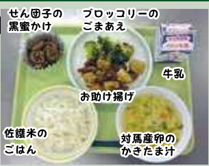
せん団子の黒蜜かけ ブロccoliーのごまあえ 牛乳 お助け揚げ 佐饗米のごはん 対馬産卵のかきたま汁

先月号でお知らせしました、対馬んうまい品給食の様子です。「お助け揚げ」「せん団子の黒蜜かけ」ともに全小中学校に好評のようでした。