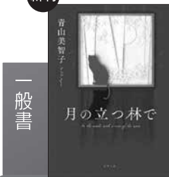
月の立つ林で (ポプラ社)