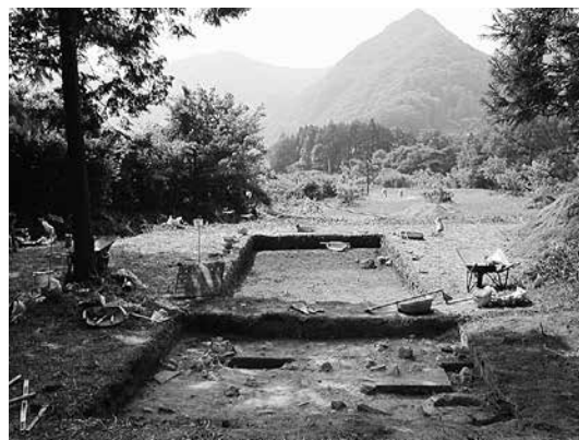
三根遺跡の発掘調査風景

遺跡南端の山辺区と呼ばれるエリアでは、竪穴式住居と高床式建物の柱穴跡が140個ほど検出されたことによって、今から2,400年前頃に人が住み始めて、約1,000年間にわたって生活が続いていたことが明らかになりました。2,400年前は縄文時代終末期にあたり、朝鮮半島南海岸などから稲作の技術や文化が伝わってきた頃です。現在までの調査結果から、三根遺跡において稲作に関連した遺物は、残念ながら出土していません。ただ、鉄製品やその生産・流通に関連する遺物が大量に出土していることや、九州北部系や朝鮮半島系の土器が出土していることから、弥生時代における対馬での文化交流の拠点となるような地域であったと考えられています。