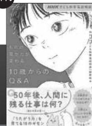
もの見かたが変わる 10歳からのQ&A (NHK出版)