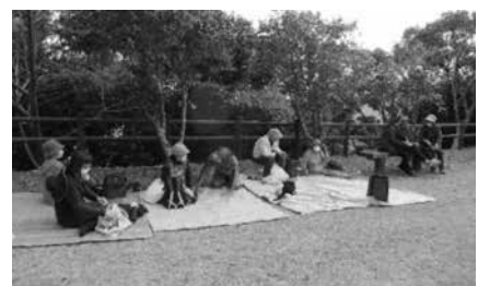
お昼はみんなでピクニック♪