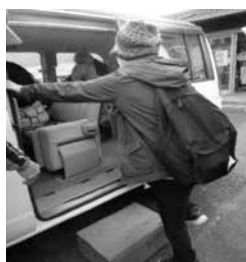
踏み台もあって安心♪