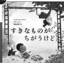
すきなものがちがうけど (ほるぷ出版)