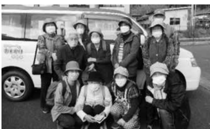
出発前の記念撮影♪