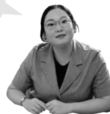
対馬市国際交流員