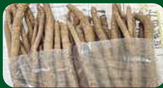
対馬産のごぼうを使用しました！