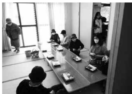
みんなでお昼ごはん