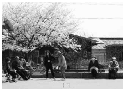
食事の前にゲートボール♪一汗かきました！