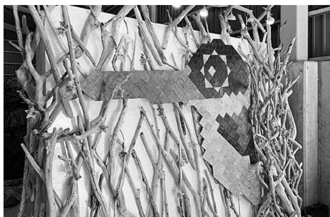
中部中継所(峰町櫛)で制作したアート作品。絵柄は対馬の代表的な渡り鳥である「ヤマシヨウビン」です。タイルづくりは対馬市西部中学校の生徒の皆さんに体験いただきました。

4月22日(土)、中部中継所において、対馬高校ユネスコスクール部や西部中学校自己表現部の生徒、市民の皆さんとの共同作業によりアート作品を制作しました。作業を通じ、生徒たちからは「色鮮やかできれい。かわいい」や「ごみを使ってアートを作れたのはとても貴重な体験」といった感想が聞かれ、ごみを「ごみ」として捉えるのではなく、価値ある資源に変えることができる可能性を参加者みんなで共有しました。