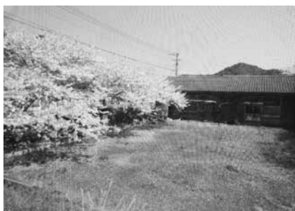
集会所からきれいな桜が見えました♪