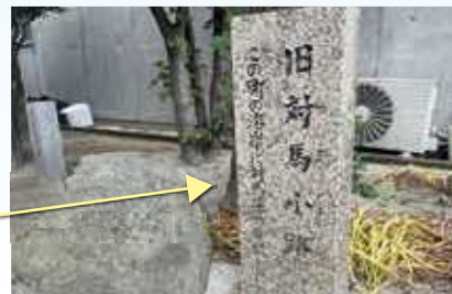
対馬小路を示す石碑