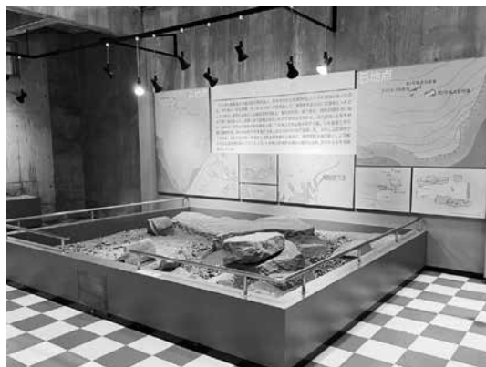
復元された遺構の展示（豊玉郷土館）

弥生時代の対馬の人々の生活の痕跡は、佐護、三根、仁位・佐保浦の3地区に集中しています。それがやがて古墳時代にはいと中心地は、美津島町雞知地区に移動していきます。ハロウ遺跡の発見は、弥生時代終末～古墳時代初頭にかけて対馬の人々の生活拠点が、全体的に南下していく過程を知る上で重要な成果であったと言えます。