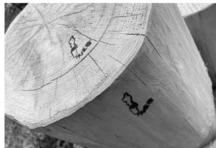
加工風景と完成品