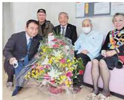
福岡対馬会の皆さんが100歳のお祝いへ