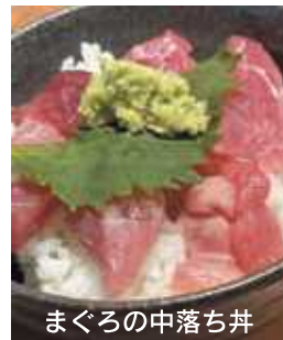
まぐろの中落ち丼