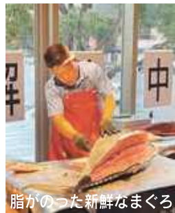
脂がのった新鮮なまぐろ