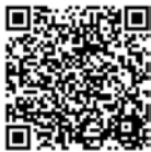
長崎地方法務局 ホームページ