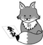
不動産登記推進イメージ キャラクター「トウキツネ」