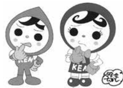
人権イメージキャラクター 人KENまもる君・人KENあゆみちゃん

夫・パートナーからの暴力やストーカー行為、職場におけるセクシュアル・ハラスメントなど…ひとりで悩まず、電話してください。