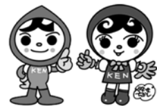
人権イメージキャラクター 人KENまもる君・人KENあゆみちゃん

家庭内のもめごとや隣近所とのトラブルなど皆様の悩みや心配ごとを相談してみませんか? 秘密は厳守されますので、お気軽にご相談ください。