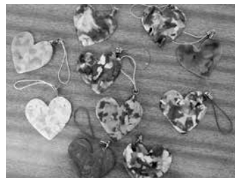
試作した海ごみキーホルダー。海ごみアートなどの学習成果物を1月末まで対馬空港2階に展示しています。ぜひ、空港にお立ち寄りください。