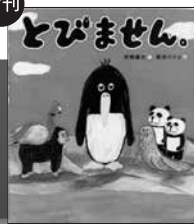
とびません。 (パイ インターナショナル) 大塚 健太/著 柴田 ケイコ/絵

鳥なのに空を飛ばないペンギン。他の鳥が誘っても飛ばません。空を飛ばないのには、ちゃんと理由があるんです。