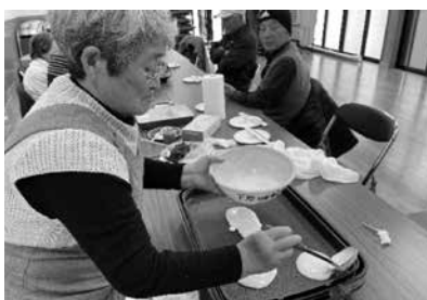
会場内はとても良い匂いが広がっていました♪