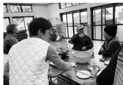
さあ！いただきましょう♪