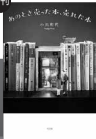
あのとき売った本、売れた本 (光文社)