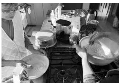
このくらいで大丈夫？と声をかけあいながらおやつ生地づくり

これからも、佐須ふれあいサロンの活動が地域に広がっていくよう、私たちもお手伝いさせていただきたいと思っております！ 第2層生活支援コーディネーター（下圏域担当）梅野