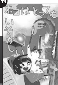
ネコはとってもいそがしい (くもん出版)