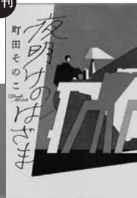
夜明けのはざま (ポプラ社)