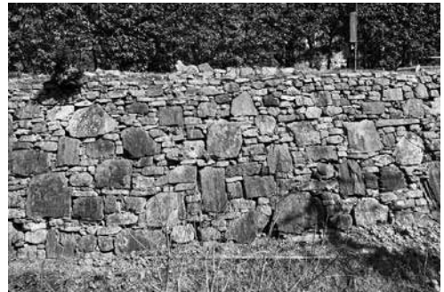
金石城跡石垣（厳原町今屋敷）

些細なことでもかまいませんので、疑問や質問がありましたらお気軽に連絡お待ちしております。