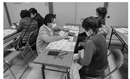
操作方法やしてみたいことも解決できました