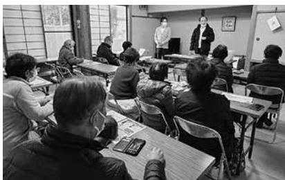
みなさんはどの機種を使っていますか?