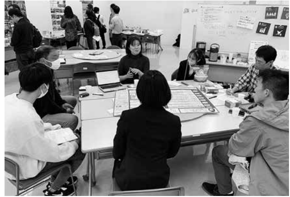
3月17日のSDGsカフェの様子

開催場所や発表テーマ、参加申込などの詳細、過去の開催記録は対馬市ホームページの中の「SDGsカフェ」をご覧ください→