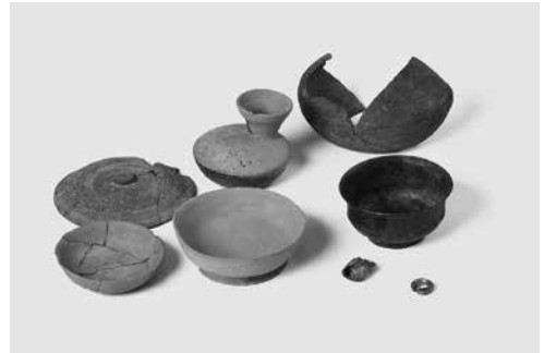
矢立山古墳群出土品（厳原町下原）

人類の長い歴史の中で生まれ、育まれ、今日まで守り伝えられてきた貴重な財産である「文化財」。来月からは、その多種多様な文化財をあらゆる側面から取り上げていきますので、文化財の魅力をこれまで以上に感じていただけたらと思います。