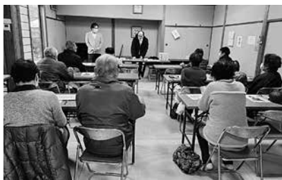
次はOSとアプリの説明(それ何のこと?)