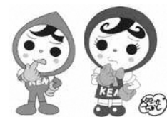
人権イメージキャラクター 人KENまる君・人KENあゆみちゃん

学校におけるいじめや家庭内における児童虐待など、こどもをめぐる様々な人権問題の解決を図るため、専用電話相談窓口である