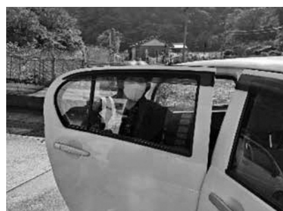
隣の地区までお願いします！