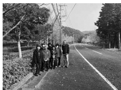
秋にはみんなで紅葉狩りにも出かけました