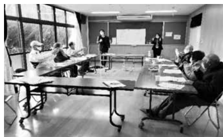
見守り活動実施に向けた話し合い